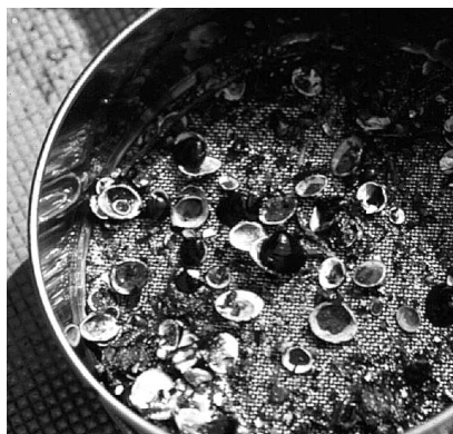
図2．ヘドロをメッシュで漉して残ったヤマトシジミの貝殻（1996年6月）．