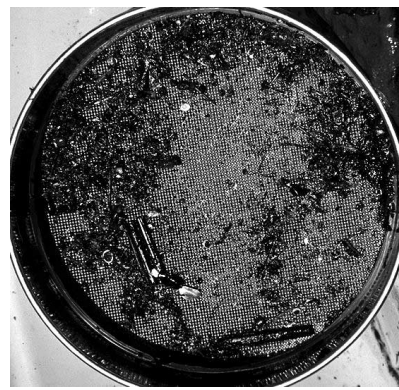
図3．ヘドロをメッシュで漉して残ったゴミ．わずかに貝殻が確認できる（1997年7月）．

要であり、地球上どこでも、河川を堰き止めて淡水域と海水域を分断すれば、堰下流にはヘドロが堆積することを意味している。その後予定されていた、矢作川と吉野川の河口堰は中止・休止となっているが、長良川河口堰の調査結果はこれらの事業に対して大きな意味を持っているものと推察される。建設省・国土交通省は堰下流の底質の調査を行っており、これをシルトと表現している。シルトとは粒子径による分類で、範囲が 1/16 (0.0625) mm から 1/256 (0.0039) mm である。これより粒子径が小さいものを粘土と分類する。両者を含めて泥