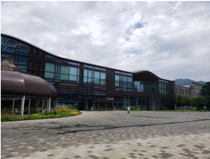
会場 ぎふメディアコスモス