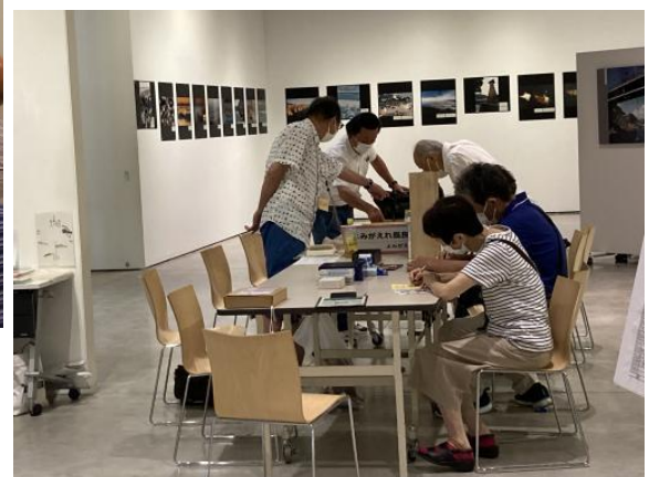
アンケートコーナー 7/9～7/13 の5日間で324筆の「長良川」 の熱い思いの感想文が寄せられました。