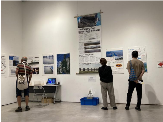
河口堰を開門しよう！