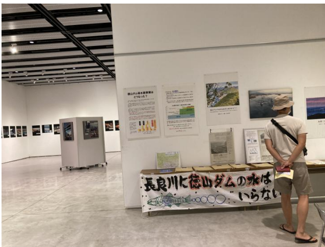
長良川に徳山ダムの水はいらない！