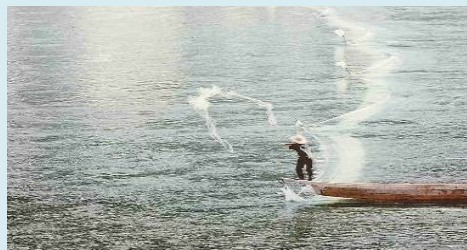
瀬張り網漁