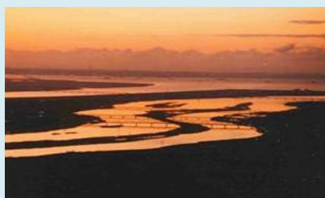
木曾三川