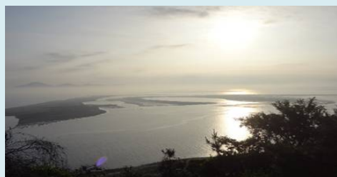
洛東江(ナクトンガン)