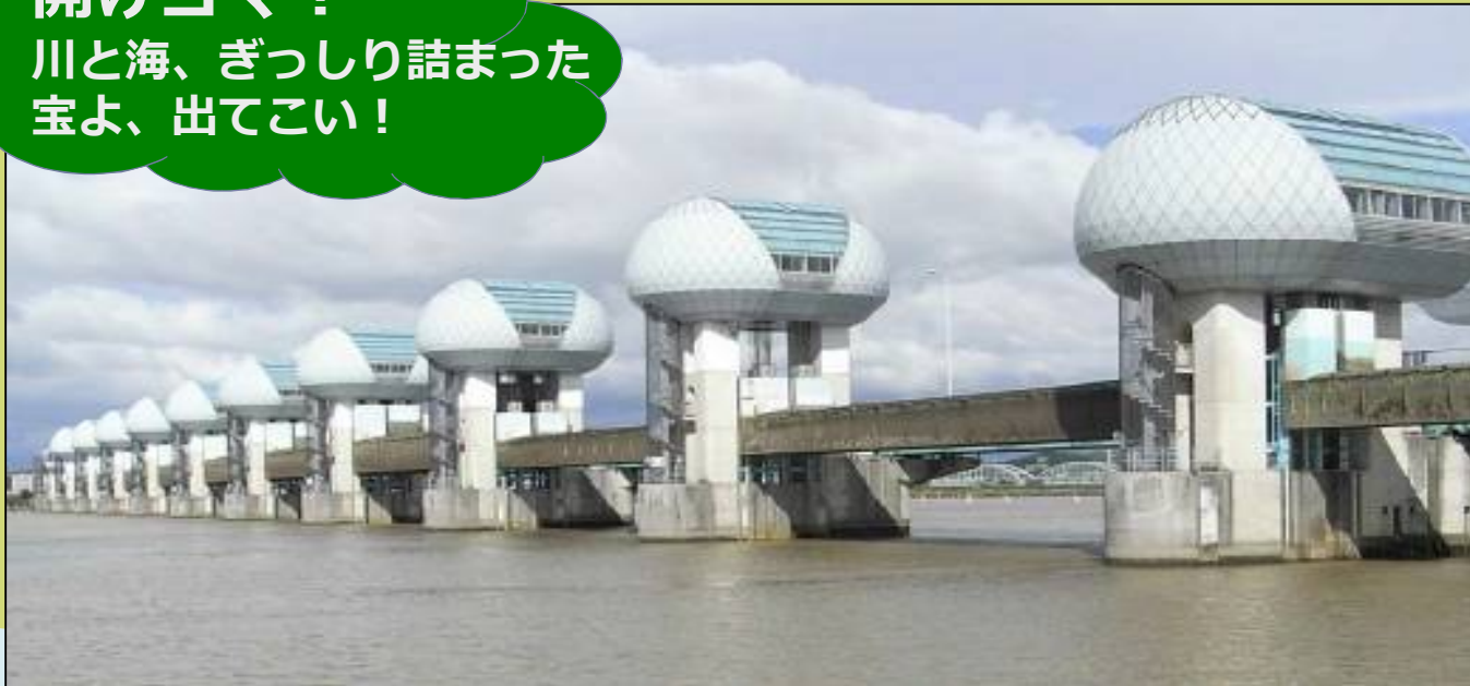
全開中の長良川河口堰